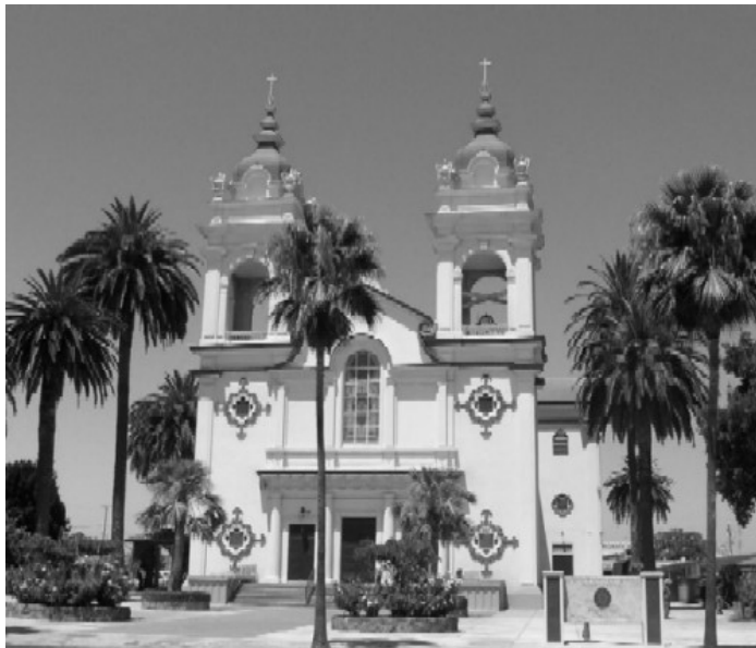
95 YEARS OF PRESENCE AND SERVICE

A Igreja das Cinco Chagas deseja ser uma comunidade Cristã unida, fundamentada na doutrina de Jesus Cristo. Liderados pelo Espírito Santo, queremos auxiliar os outros e ser hospitaleiros para todos tendo sempre como foco principal JESUS NA EUCARISTIA.